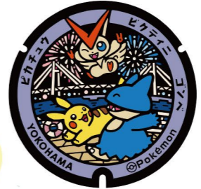
4 臨港パーク Rinko Park