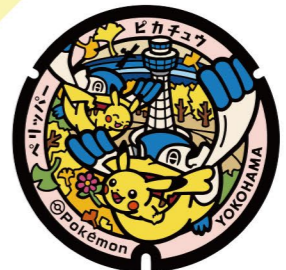
2 横浜マリナタワー Yokohama Marine Tower