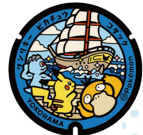
3 日本丸メモリアルパーク Nippon Maru Memorial Park