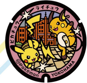
5 赤レンガパーク Aka-Renga Park