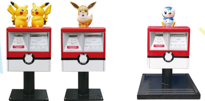
6 横浜市中区役所 Yokohama City Hall

ポケふたとあわせて見つけてみよう! Try to find these in addition to the Poké Lids!