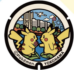
1 JR桜木町駅前広場 JR Sakuragicho Station Square

『ポケふた』とは? What are Poké Lids? ポケモンがデザインされたマンホール蓋で、ポケモンたちの魅力と各地域の魅力を知っていただくことを目的に、オリジナルでデザインし、それぞれ世界に一つだけのマンホールとして全国各地に設置されています。 Poké Lids are utility hole covers featuring Pokémon designs. Each one-of-a-kind cover is given an original design and installed at a utility hole in Japan to promote the appeal of Pokémon and the charms of the local region.