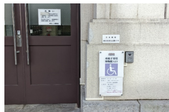
車いす専用入り口