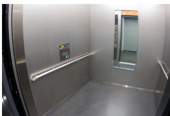
一般・車いす共用エレベーター