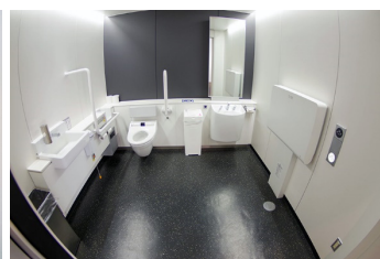
多機能トイレ（内部）