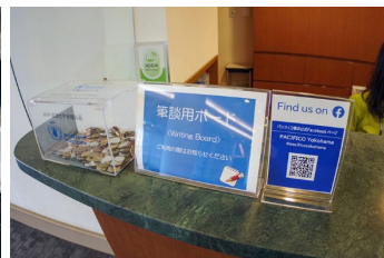
筆談対応（インフォメーション）