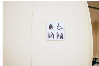
サイン（多機能トイレ内）