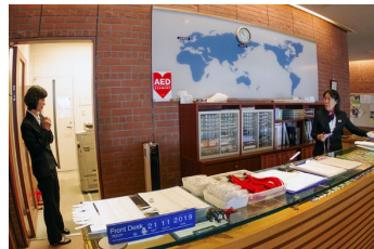
インフォメーション