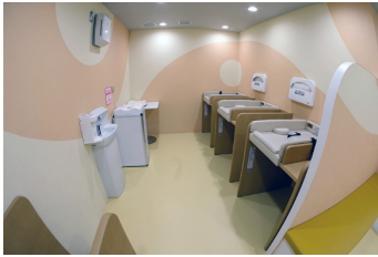
おむつ交換場所 (キッズパーク「PuChu!」施設内)