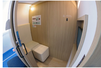
キャビネット型授乳室 (内部)