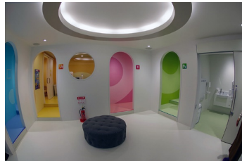
トイレスペース （キッズパーク「PuChu!」施設内）