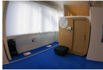
ベビーカー置き場とキャビネット型授乳室 室 (外観)