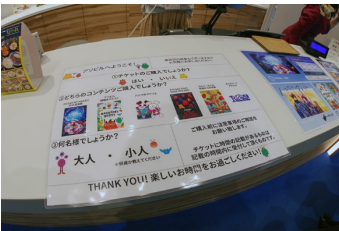
指差しシート（受付）