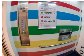
一般・車いす共用エレベーター