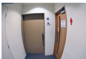
多機能トイレと一般トイレ