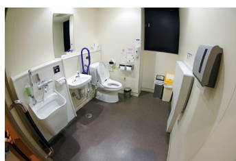
多機能トイレ（内部）