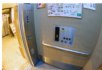
一般・車いす共用エレベーター