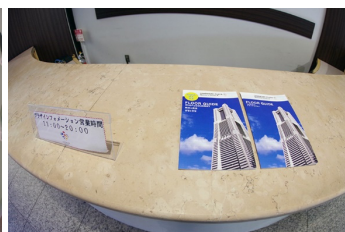
多言語パンフレット