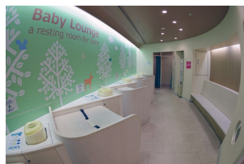
おむつ交換台（赤ちゃん休憩室）