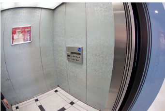
一般・車いす共用エレベーター