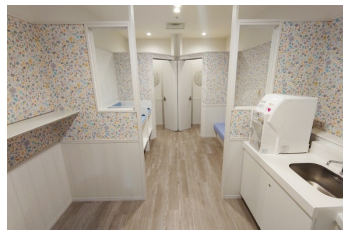
ベビールーム（おむつ交換台、授乳室）