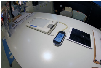
筆談機及び多言語端末（インフォメーション）