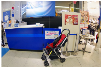
貸出用ベビーカー（インフォメーション）