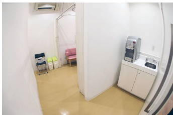
授乳室：1階のエントランスホール大階段下にあります。