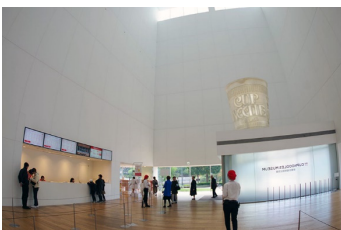
エントランス：館内はバリアフリーとなっており、車椅子の方や高齢の方も安心してお楽しみいただけます。また、エレベーターもあります。