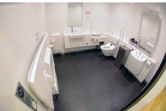
多機能トイレ内部