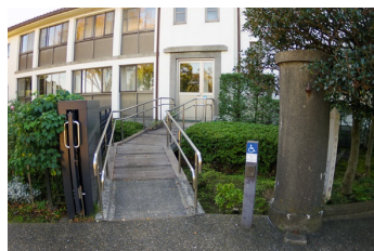
車いす用入り口スロープ