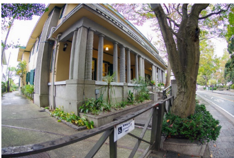
車いす用スロープ（エントランス前）