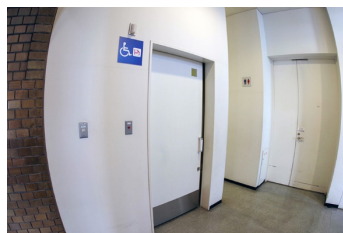
多機能トイレ(ドア)