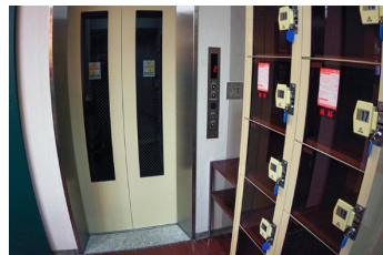
一般・車いす共用エレベーター