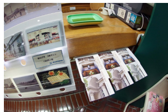
英語パンフレット(受付)