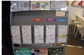
多言語パンフレット