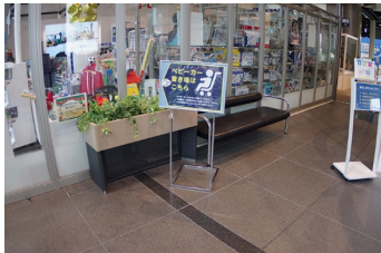
ベビーカー置き場