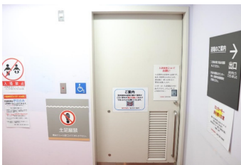
更衣室内バリアフリートイレ