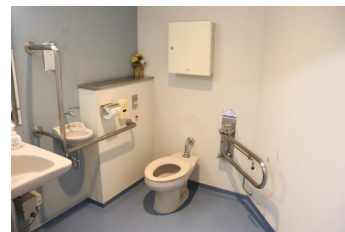
更衣室内バリアフリートイレ