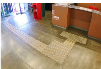
点字サイン（エントランス）