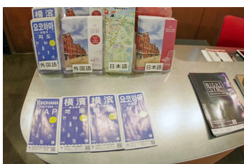
多言語パンフレット