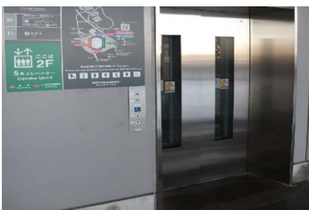
場外エレベーター