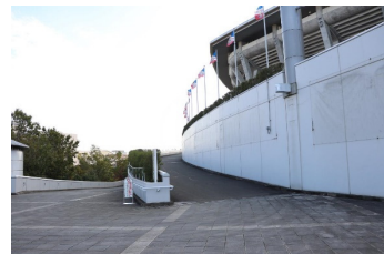
場外 東ゲートスロープ