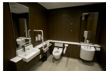
多機能トイレ（内部）