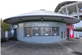
場外 東ゲートトイレ