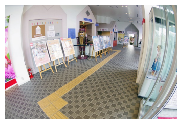
点字ブロック（エントランス）