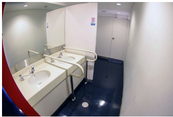
手洗いカウンター（一般用トイレ）