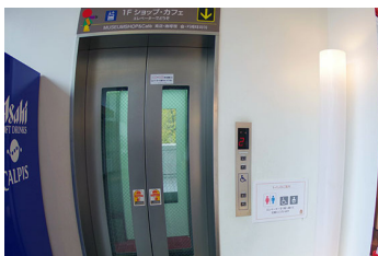
一般・車いす共用エレベーター