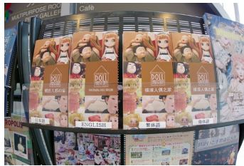
多言語パンフレット