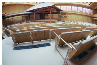
車いす専用鑑賞スペース