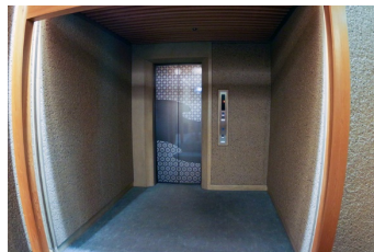
一般・車いす共用エレベーター