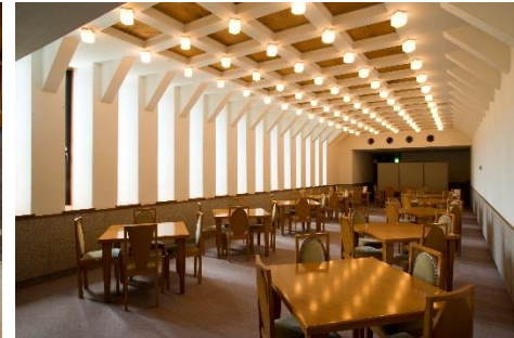
2階レストランススペース

お手数ではございますが、ご出席をご希望の際は、 平成29年11月30日(木)まで に、下記をご記入のうえ、メールまたはFAXでお送りください。