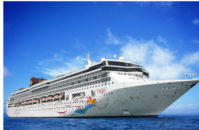
スーパースターヴァーゴ (初入港7/9)