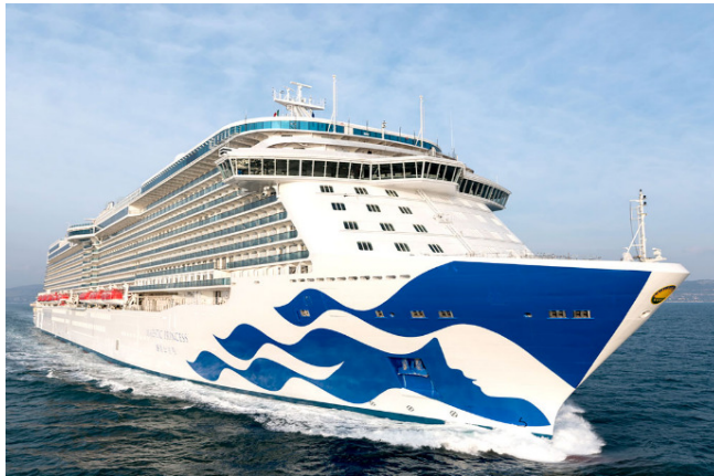
マジェステックプリンセス (初入港7/3)