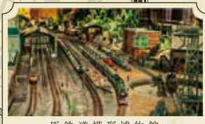
原鉄道模型博物館