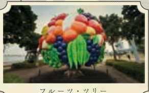
フルーツ・ツリー