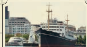
山下公園・日本郵船水川丸