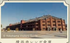
横浜赤レンガ倉庫