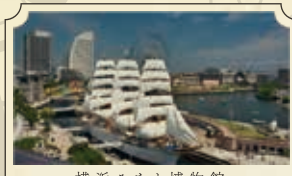
横浜みなと博物館