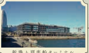
新港ふ頭客船ターミナル